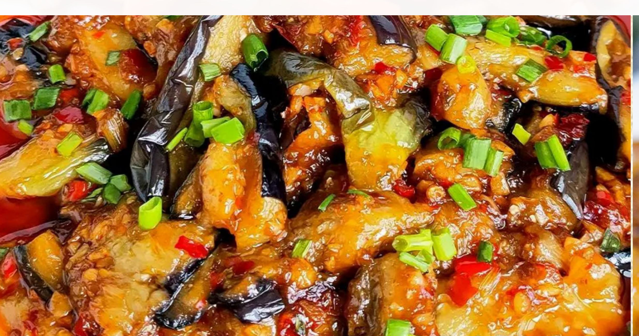
10 鱼香茄子 $85