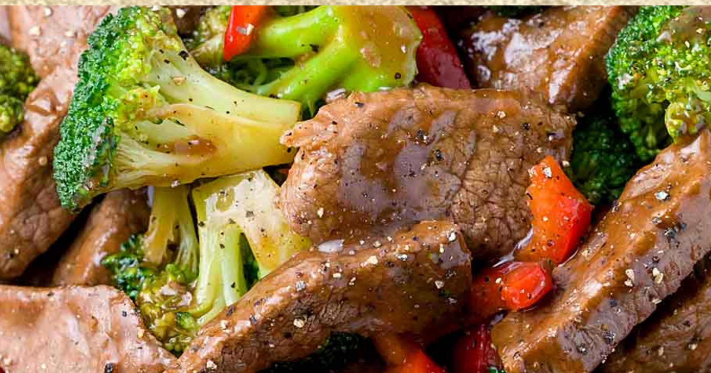
1 西兰花炒牛肉 $72