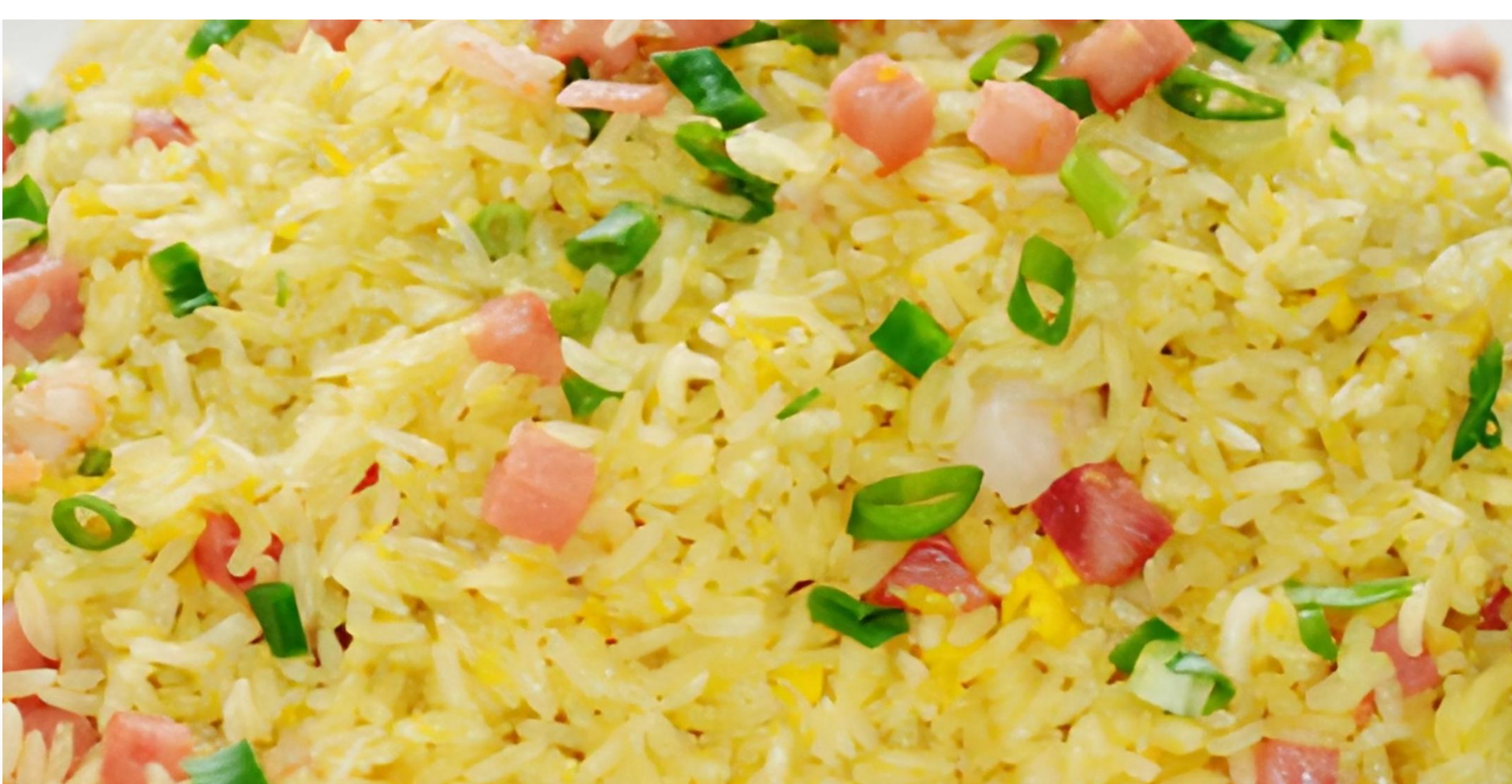
5 扬州炒饭 $60