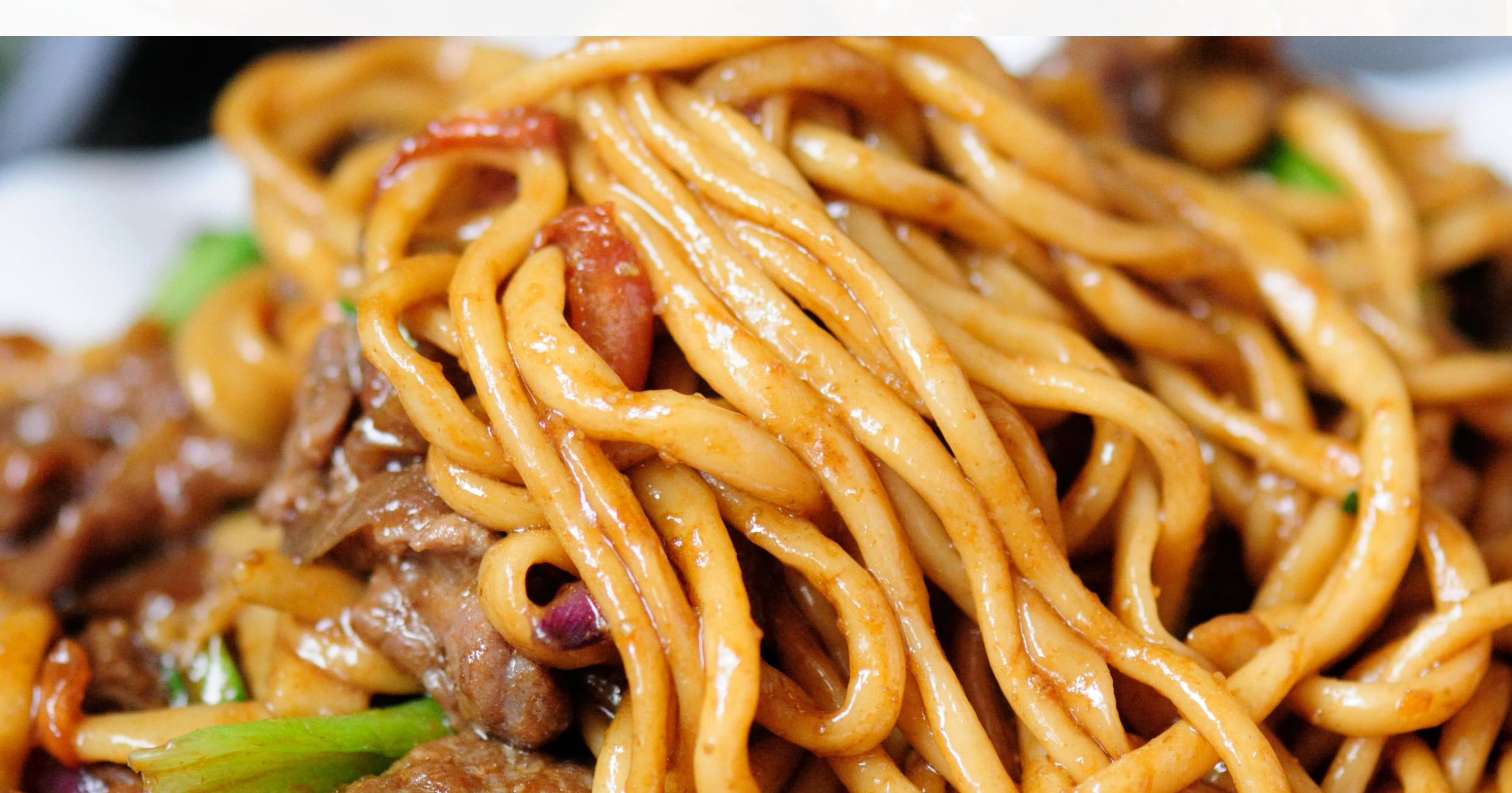
11 肉丝炒面 $85