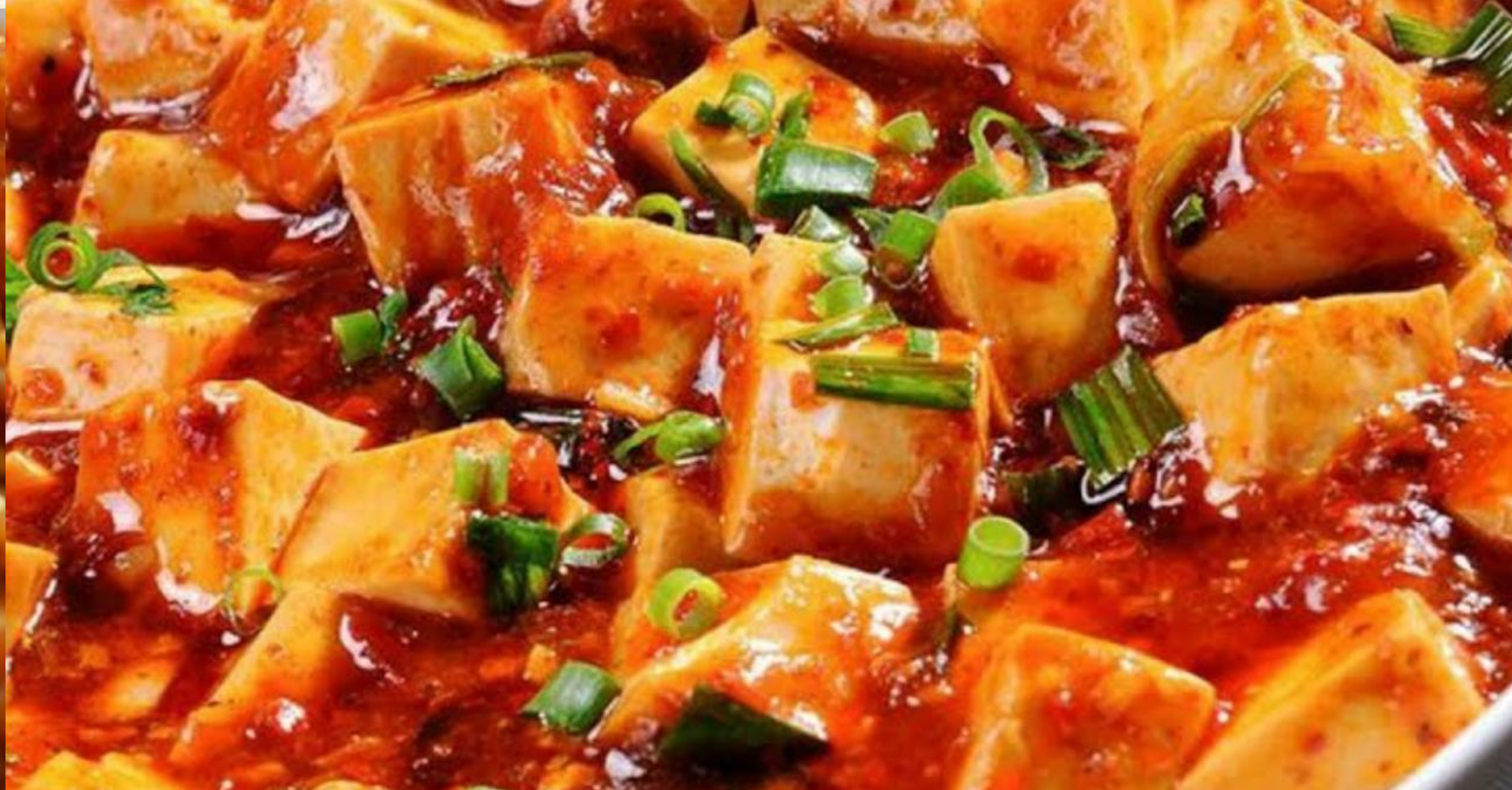
3 麻婆豆腐 $60