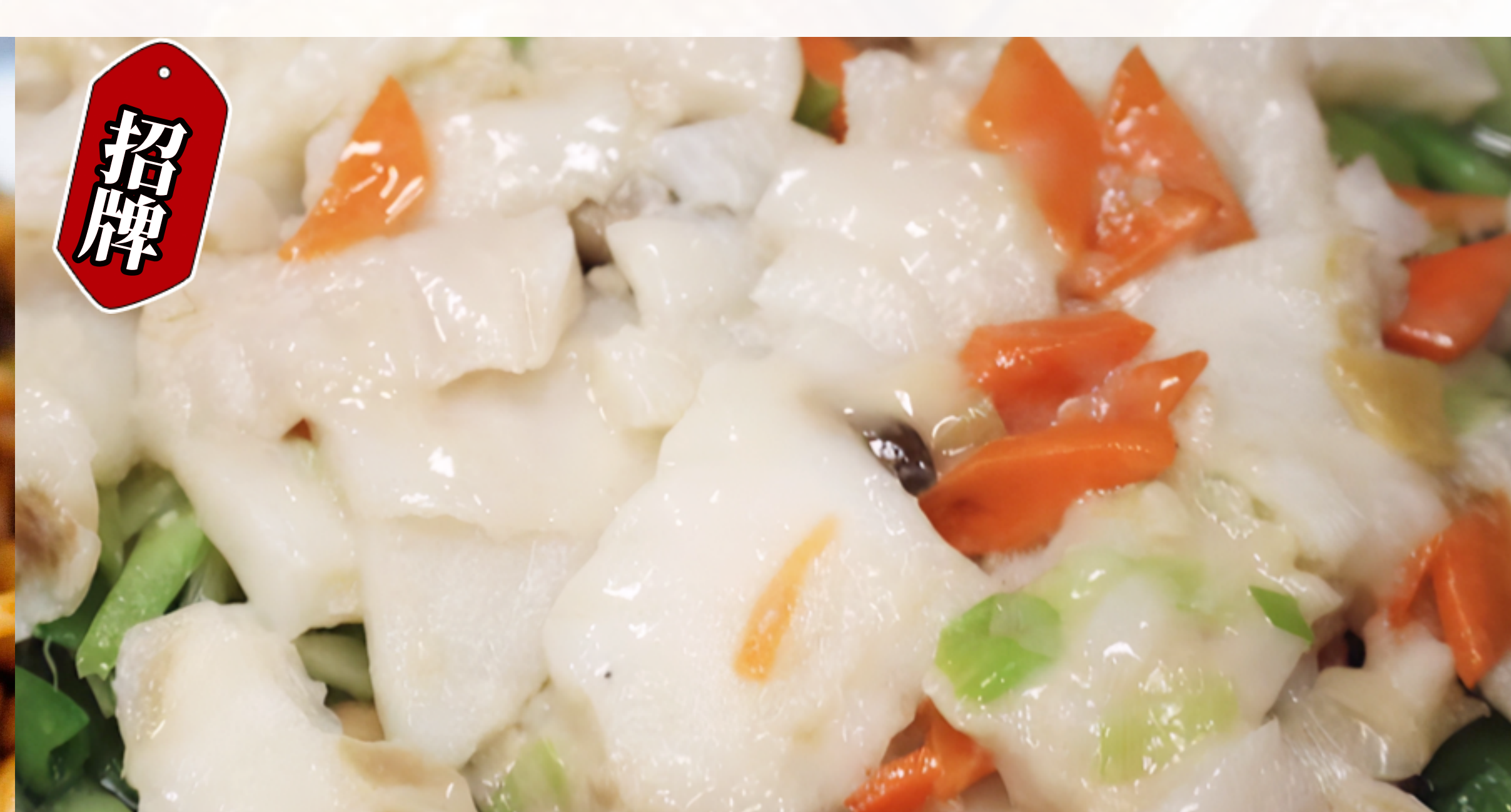
12 招牌 时菜炒班球 $92