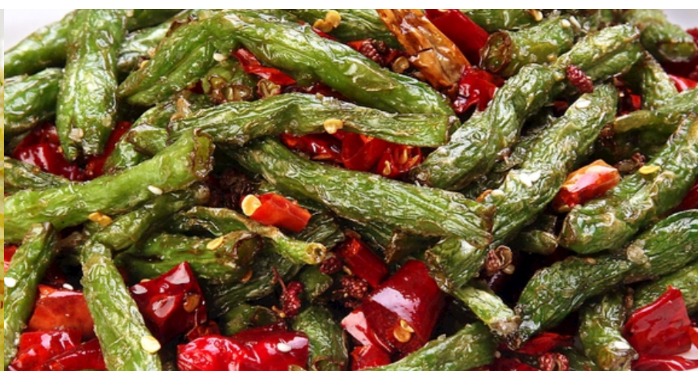
6 干煸四季豆 $65