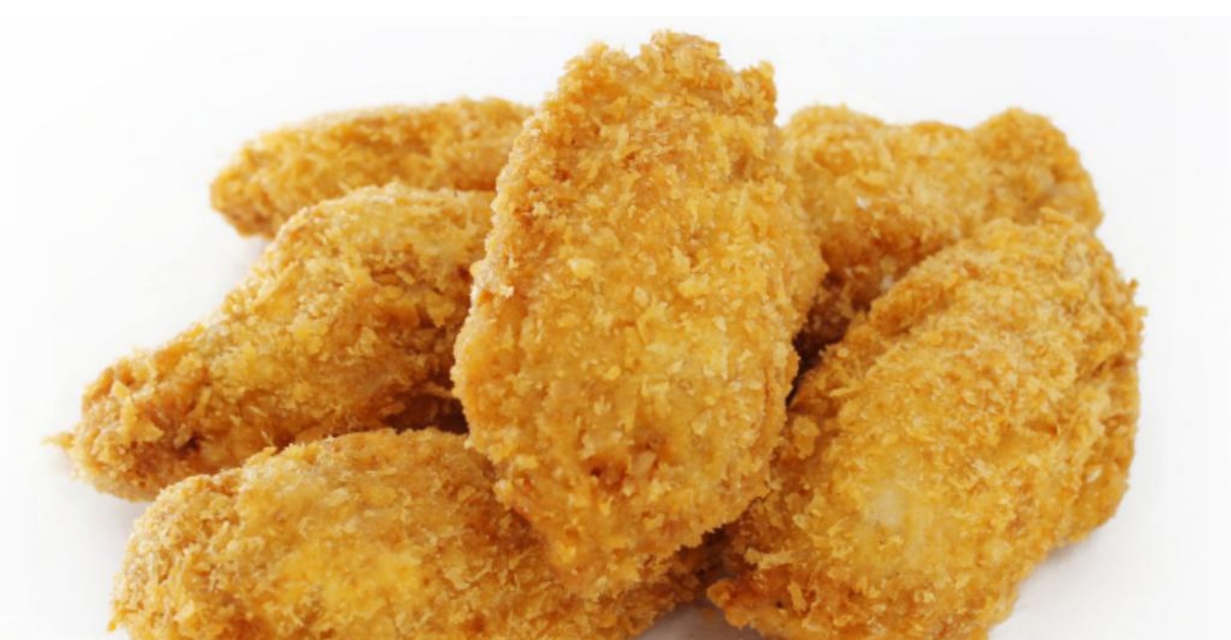
4 炸鸡翅 (24只) $65