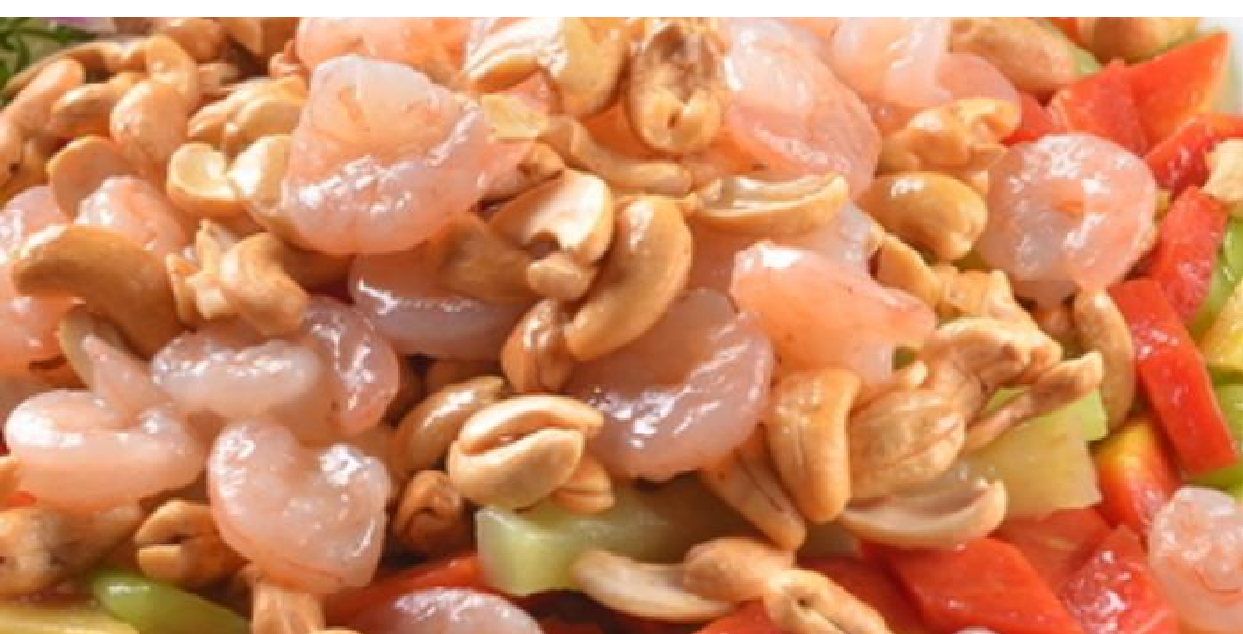
7 七彩腰果虾仁 $85