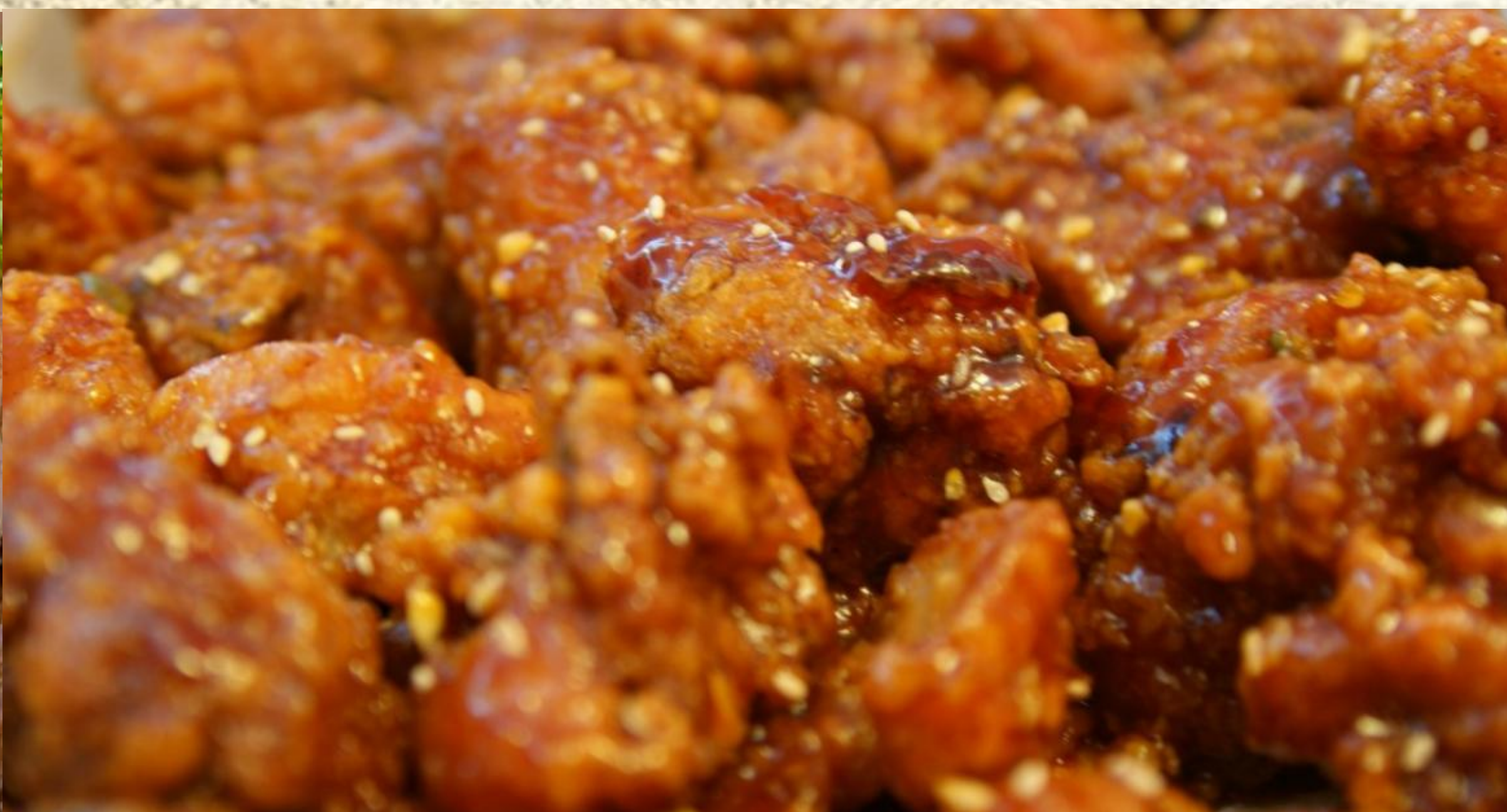
2 左宗鸡 $75